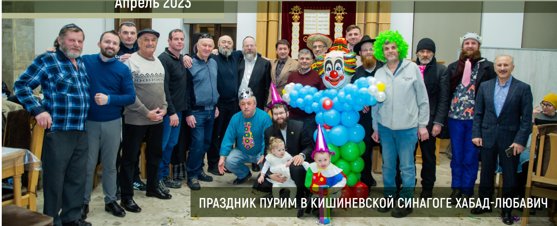
ПРАЗДНИК ПУРИМ В КИШИНЕВСКОЙ СИНАГОГЕ ХАБАД-ЛЮБАВИЧ

ИНФОРМАЦИОННАЯ КУЛЬТУРНО-ПРОСВЕТИТЕЛЬСКАЯ ЕВРЕЙСКАЯ ГАЗЕТА ХАБАД-ЛЮБАВИЧ GAZETA INFORMĂTIONĂLĂ CULTURAL-EDUCATIVĂ EVREIASĂ "HABAD LIUBAVICI"